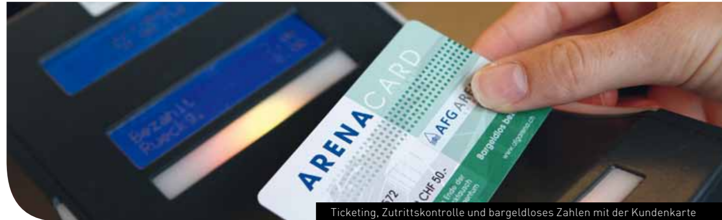
Ticketing, Zutrittskontrolle und bargeldloses Zahlen mit der Kundenkarte