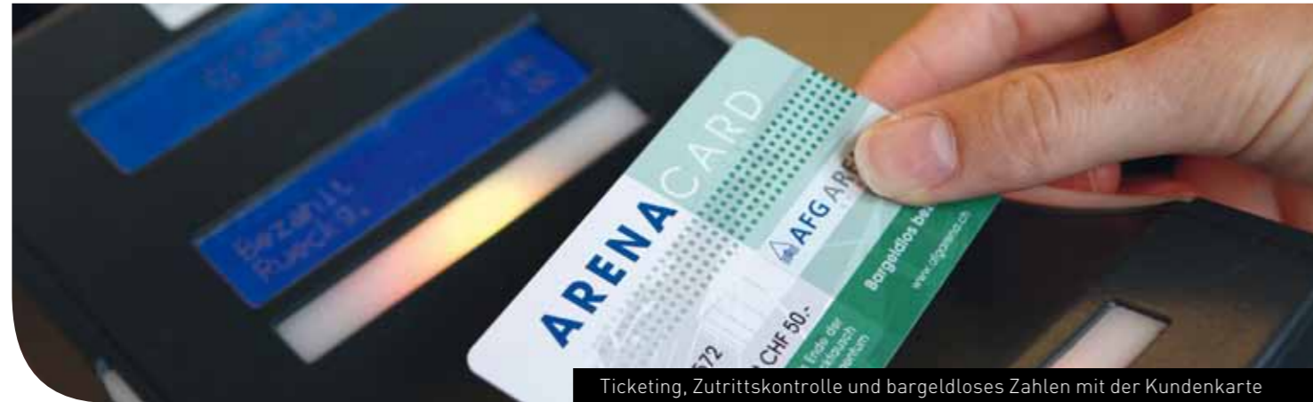
Ticketing, Zutrittskontrolle und bargeldloses Zahlen mit der Kundenkarte